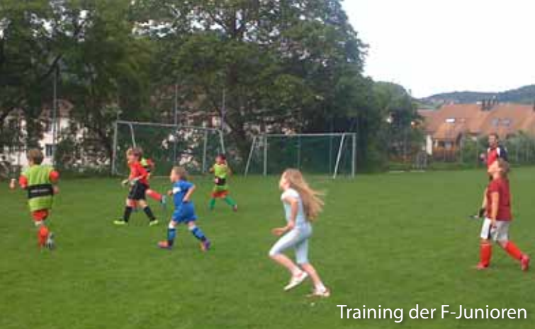
Training der F-Junioren