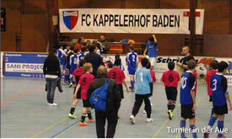
Turnier in der Aue