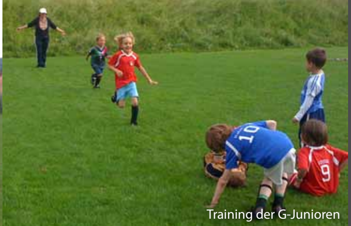
Training der G-Junioren