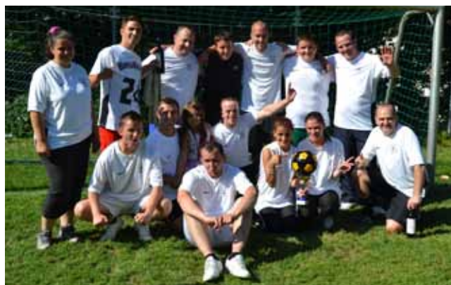
Die Sieger bei den Erwachsenen: das Brisgi-Team